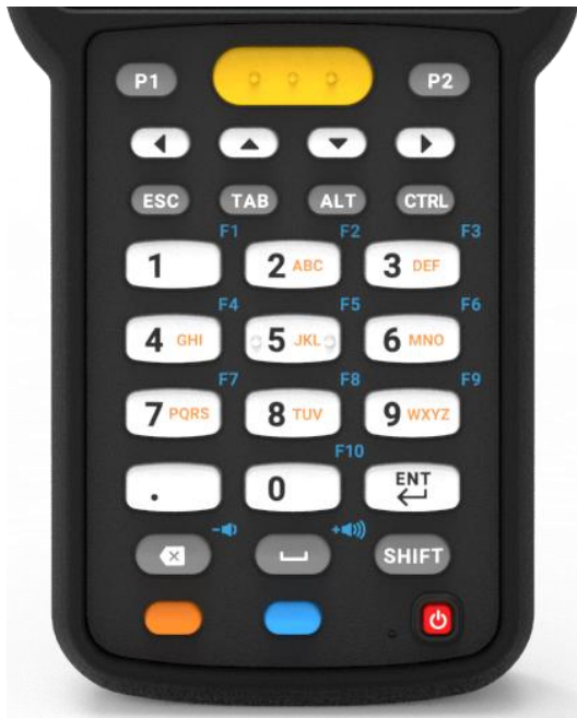
29 Key - numerisch