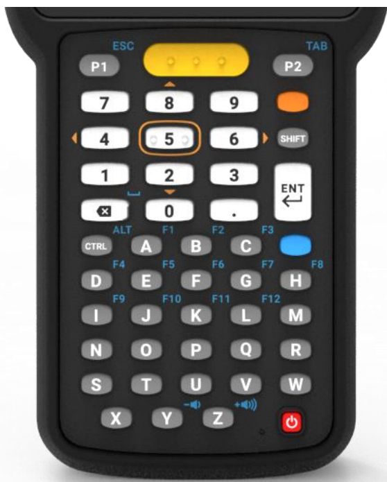
47 Key - alphanumerisch

IdentWERK – Mehr als nur Hardware!! Als Auto-ID-Systemhaus unterstützen wir Sie auch bei Service und Support, der zentralen Geräteverwaltung und sind Ihr Ansprechpartner für die professionelle WLAN Infrastruktur oder die mobile Scan-Anwendung auf Ihrem Zebra MC3300.