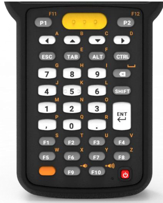
38 Key - numerisch + F-Key