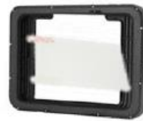
Schutzfolie 8 oder 10 Zoll (mit Rugged Frame).