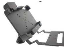
Tastatur Befestigung für Fahrzeughalterung.