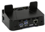
USB Single-Slot Cradle für ET50 mit oder ohne Frame