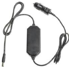
12V Fahrzeug-Ladekabel mit Zigarettenanzünder- Adapter