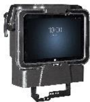
Robuste Fahrzeug Docking mit LAN/USB Anschlüssen. Ideal für Staplereinsatz. (Details siehe unten)