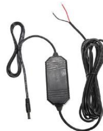
12V Fahrzeug-Ladekabel mit offenen Enden