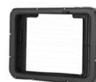
Rugged Frame Schutzrahmen für 8 oder 10 Zoll