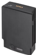
Zusatzakku, 6800 mAh für Expansion Back