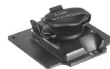
Expansion Back (Rotierender Hand Strap)