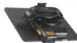
Expansion Back mit 2D Imager SE4750 oder SE4710 Für Android