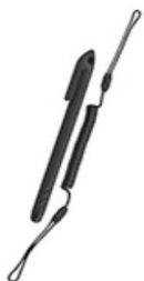
Stylus / Bedienstift passive und aktive Varianten