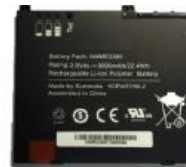
Ersatzakku 10 Zoll, 4950 mAh. 8-9 Stunden Betrieb und Display an 7-8 Stunden Betrieb und Display an