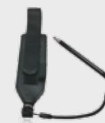
■ 94ACC0133 Handschlaufe (im Lieferumfang dabei)