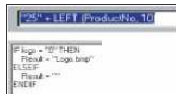
Intelligente Formulare dank VB-Script-Unterstützung

Sprechen Sie mit uns. Und überzeugen Sie sich selbst