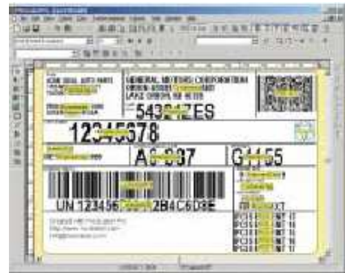
Selbst komplexe 2D-Label sind kein Problem