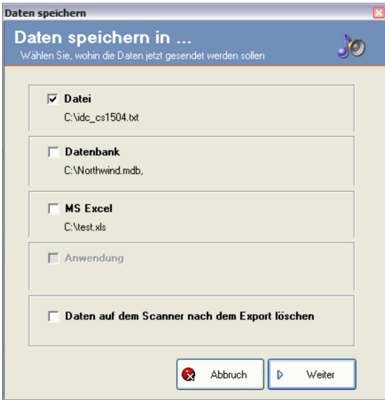
Einfache Weiterverarbeitung der empfangenen Daten

Profile ermöglichen das Speichern bestimmter Konfigurationen für unterschiedliche Aufgaben. Somit lassen sich über Profile beispielsweise Benutzer-, Stations- oder Aufgabenspezifische Besonderheiten berücksichtigen. Mit IDC V4 können angelegt, geändert, gespeichert und gelöscht werden.